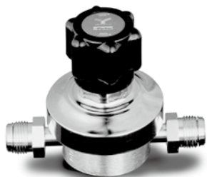
HFR900W (Catalog 4508)