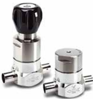
BFR5K (Catalog 4508)