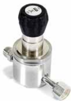
HF1200 (Catalog 4508)